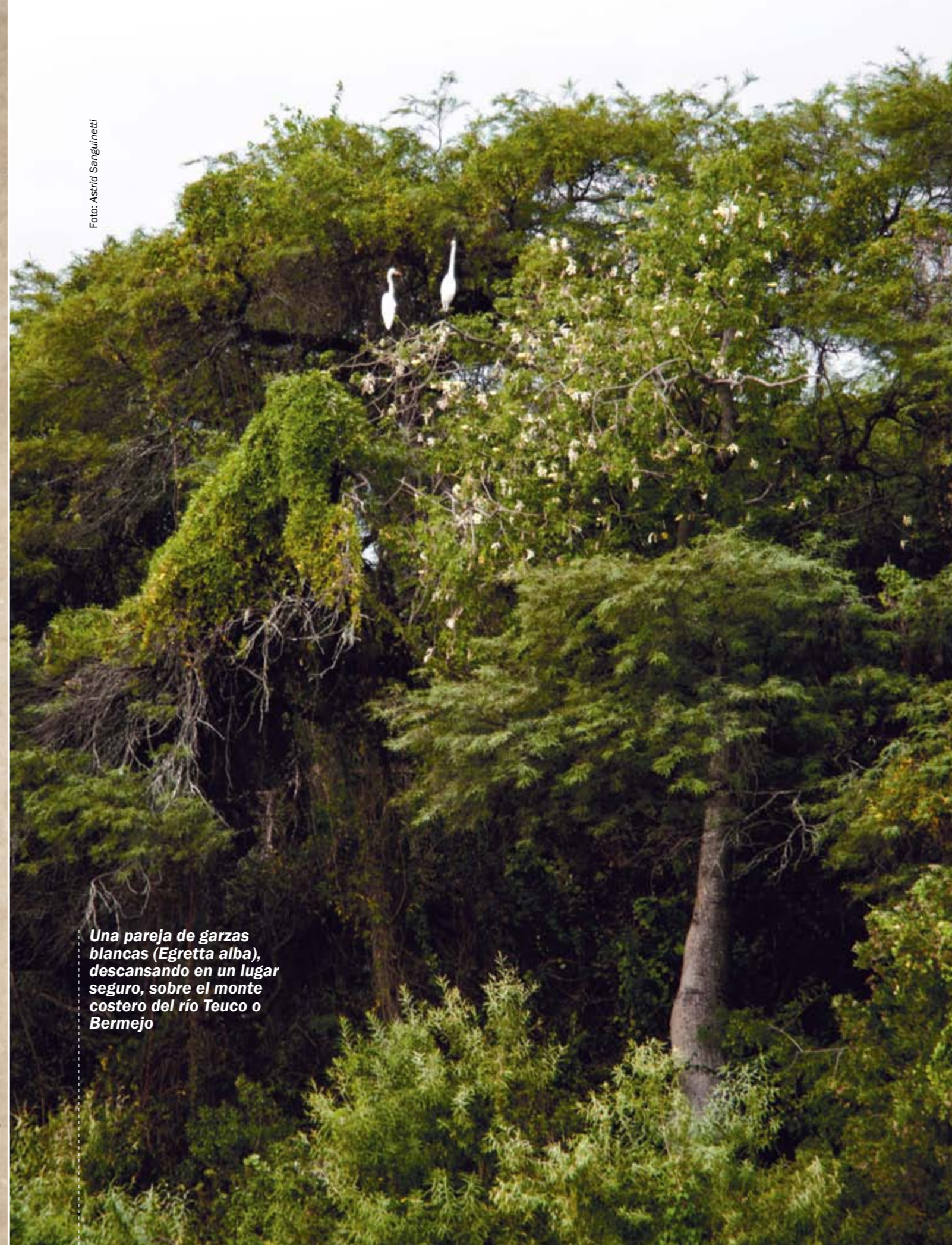
Una pareja de garzas blancas ( Egretta alba ), descansando en un lugar seguro, sobre el monte costero del río Teuco o Bermejo