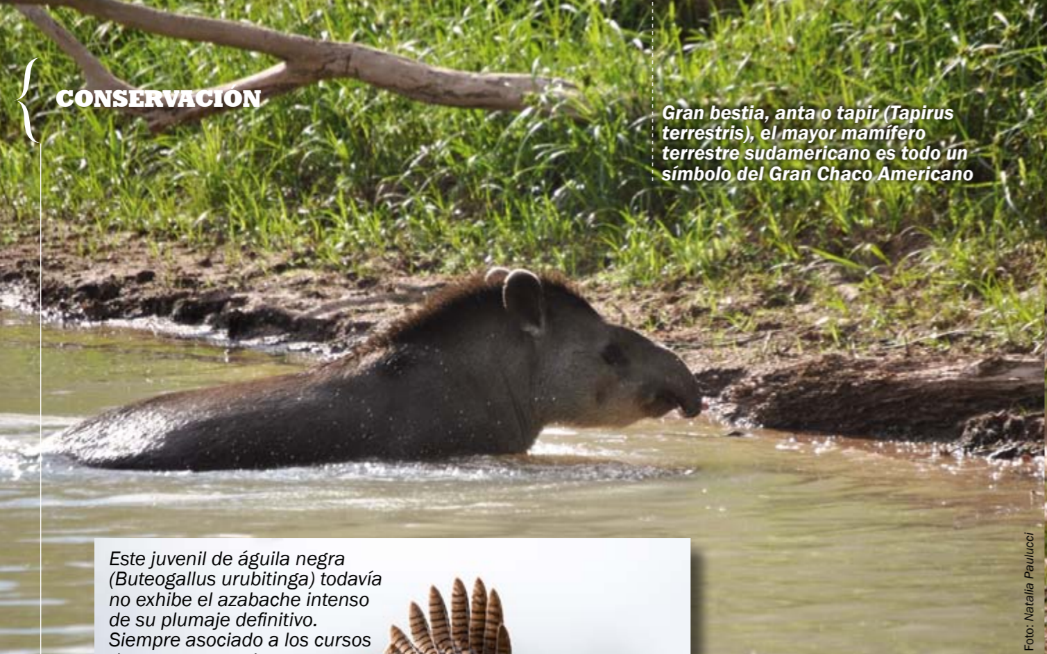
Gran bestia, anta o tapir ( Tapirus terrestris ), el mayor mamífero terrestre sudamericano es todo un símbolo del Gran Chaco Americano